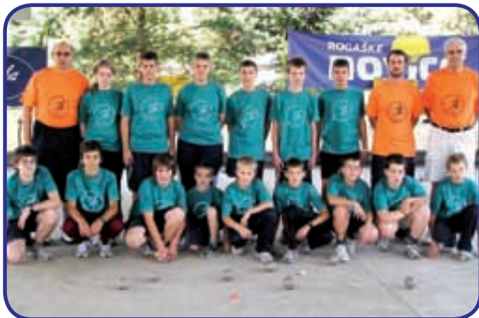
Prva skupina slušateljev šole