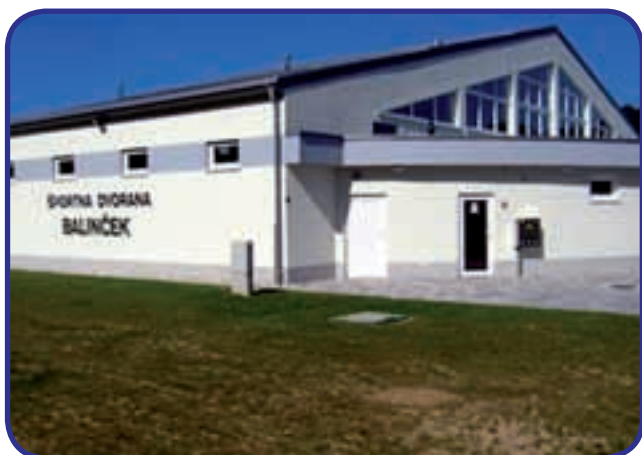
Balinček – velika pridobitev