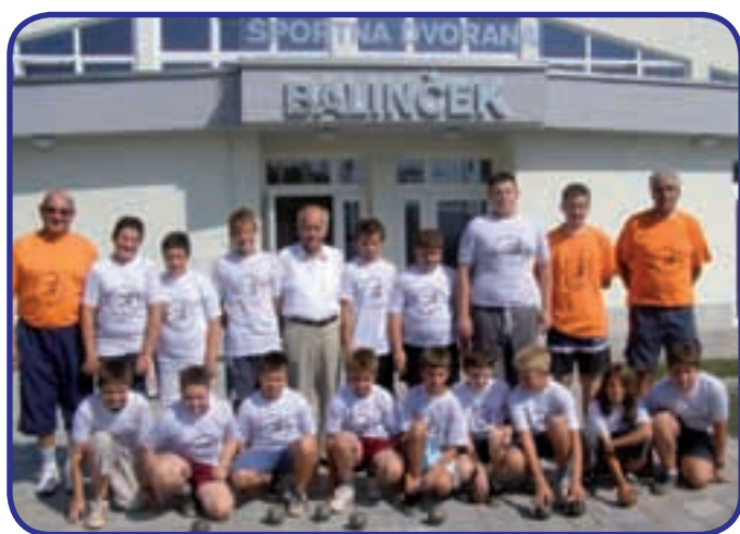
Druga skupina slušateljev v Rogaški Slatini