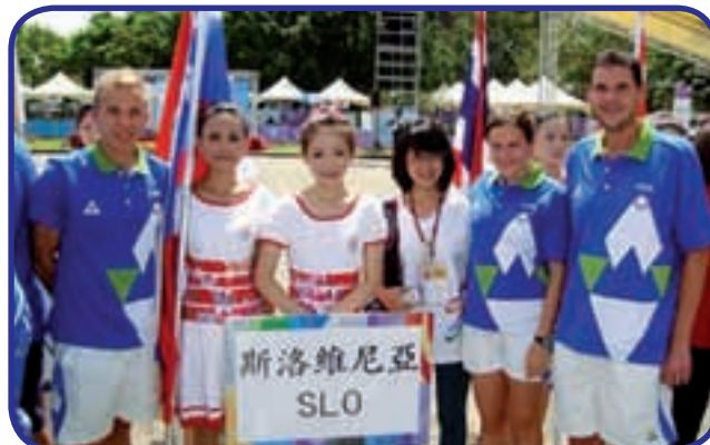
Naša reprezentanca na otvoritvi v Tajvanu

Soligon (Italija) – Huang (Tajvan) 33/41 : 27/45