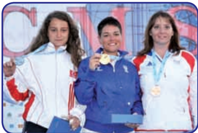
Kumartasuogo, Botteon, Bruniaux