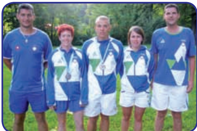
Slovensko zastopstvo na SI v Pescari