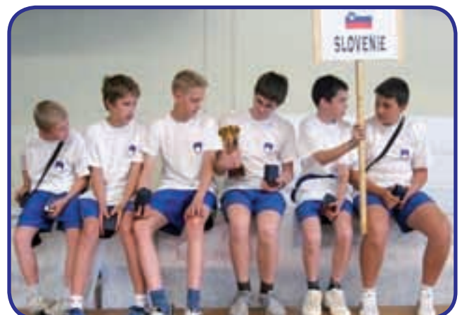
Naša reprezentanca v Franciji

Vrstni red: 1. Francija 9, 2. Italija 6, 3. Slovenija 1 (-18) , 4. Hrvaška 1 (-20).